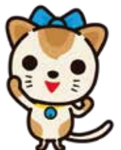
MG保証キャラクター 「ジョー」