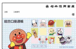
アンパンマン通帳