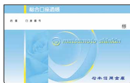
スタンダード通帳